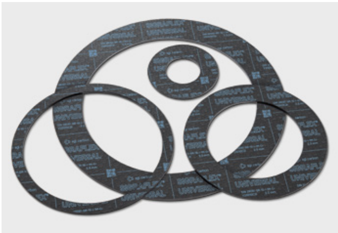
↑ Dichtungen aus SIGRAFLEX UNIVERSAL