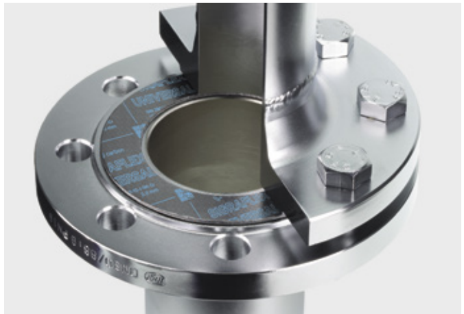
↑ Flansch mit SIGRAFLEX UNIVERSAL Flachdichtung